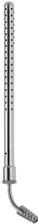
POOLE 04140.06 ø 6 mm (18 Charr.) 04140.08 ø 8 mm (23 Charr.)