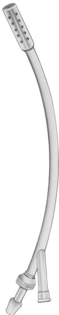
FINSTERER 04158.00 32 cm

Saug- und Spülkanüle Suction and Irrigation Cannula Canules d'aspiration et d'irrigation Cánulas para aspiración e irrigación Cannule per aspirazione e irrigazione