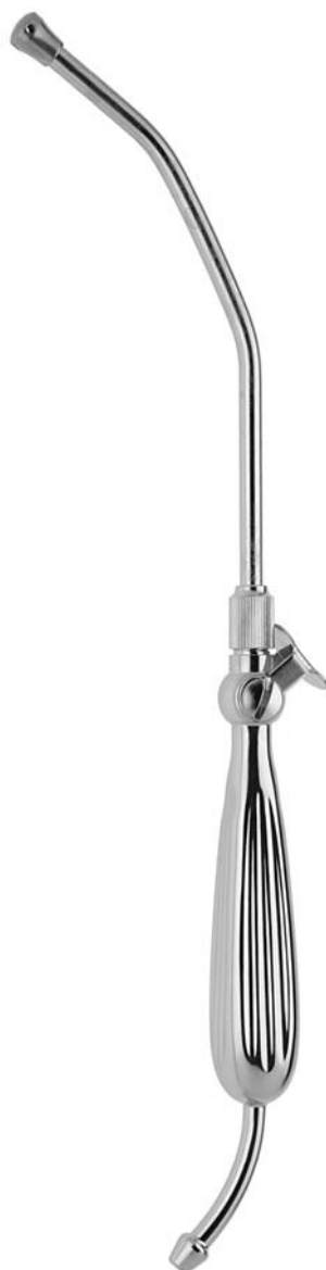
WALTON YANKAUER 04152.33 ø 10 mm (30 Charr.) 32 cm

mit Absperrventil und abschraubbarem Rohr