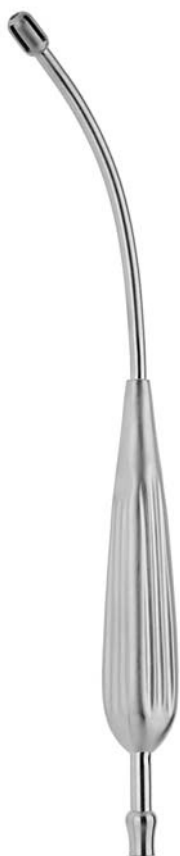
ANDREW-PYNCHON 04151.24 ø 6 mm (18 Charr.) 23 cm